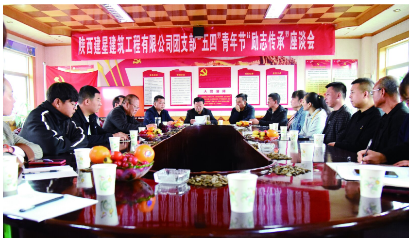
▲ 组织“励志传承”座谈会